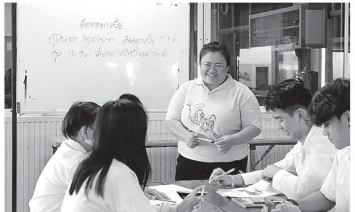
ครูในสังกัดสำนักงานส่งเสริมการศึกษานอกระบบและการศึกษาตามอัธยาศัย (กศน.) ทั่วประเทศจัดการเรียนการสอนให้กับผู้ที่เคยพลาดโอกาสทางการศึกษาให้ได้มีโอกาสกลับเข้ามาเรียนในระบบการศึกษาอีกครั้ง.

สำรวจข้อมูลประชากรวัยเรียนที่อยู่นอกระบบการศึกษา และการจัดกรองกลุ่มเป้าหมาย โดยลงพื้นที่สอบถามติดตามกลุ่มเป้าหมายที่ปรากฏในระดับจังหวัด ระดับอำเภอ ระดับตำบล และหมู่บ้าน พบกลุ่มเป้าหมายที่ต้องนำเข้าสู่ระบบการศึกษาจำนวนทั้งสิ้น 470,591 คน มีทั้งกลุ่มเด็กพิการ กลุ่มเด็กปกติที่ไม่เคยได้รับการศึกษา กลุ่มเด็กออกกลางคันและกลุ่มเด็กที่จบ ม.3 แล้ว แต่ยังไม่ได้เรียนต่อ ซึ่ง ขณะนี้สถานศึกษาในสังกัดสำนักงาน กศน. ได้รับสมัครและลงทะเบียนหลักสูตรการศึกษานอกระบบระดับการศึกษาขั้นพื้นฐาน การศึกษาเพื่อพัฒนาอาชีพ การศึกษาเพื่อพัฒนาทักษะชีวิต การศึกษาเพื่อพัฒนาสังคมและชุมชน การจัด